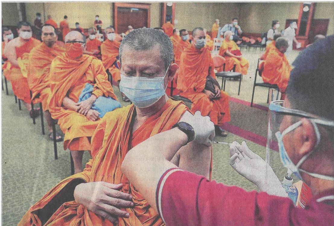
▲ฉีดให้พระ เจ้าหน้าทีกรมการแพทย์ กระทรวงสาธารณสุข เข้ามาถวายการฉีดวัคซีนป้องกันโควิด-19 เข็มแรกแก่พระสงฆ์ที่มีอายุมากกว่า 60 ปี และอยู่ในกลุ่มเสี่ยง 7 กลุ่มโรค ใน รพ.สงฆ์ พร้อมตั้งเป้าทยอยฉีดวัคซีนให้พระสงฆ์ใน กทม. ที่มีอยู่ราว 13,000 รูป จากทั้งหมด 17,636 รูป ใน 457 วัด จนครบเป้าหมาย คาดจะฉีดได้ 300-500 รูปต่อวัน.

ข่าวประจำวันพุธที่ ๑๙ พฤษภาคม ๒๕๖๔ หน้าที่ ๑